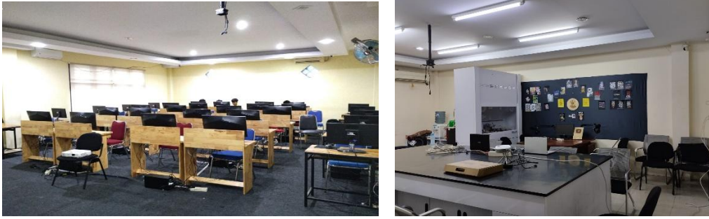
Gambar 2. Kegiatan Produksi Video Company Profil Fakultas Teknologi Universitas Battuta Medan Dengan Adobe Premier Cc 2019

Berdasarkan pengamatan langsung selama dilapangan, kegiatan pengabdian pada masyarakat ini memberikan hasil sebagai berikut: