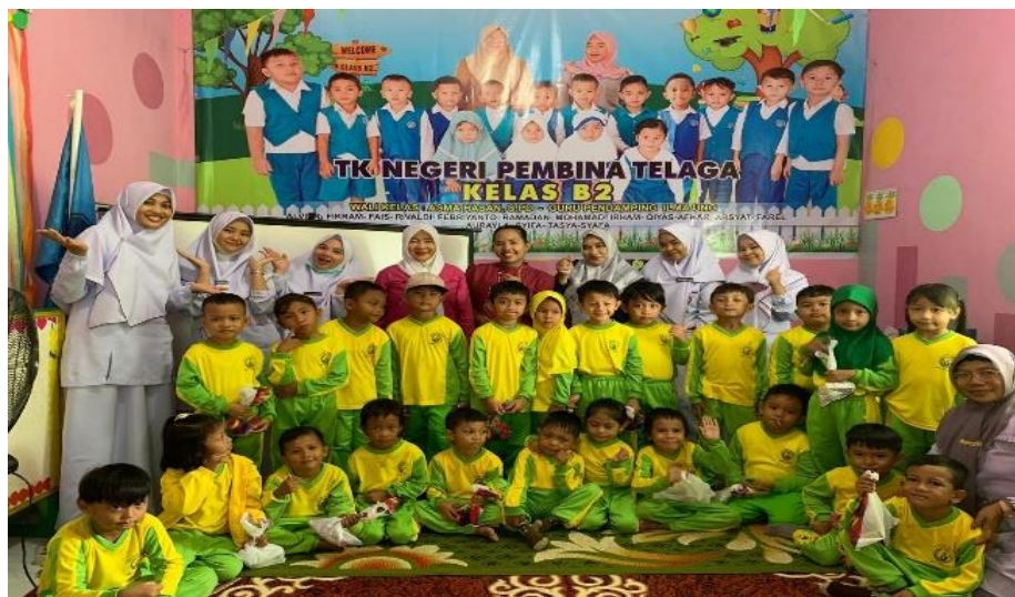
Gambar 2. Sesi foto bersama dengan peserta