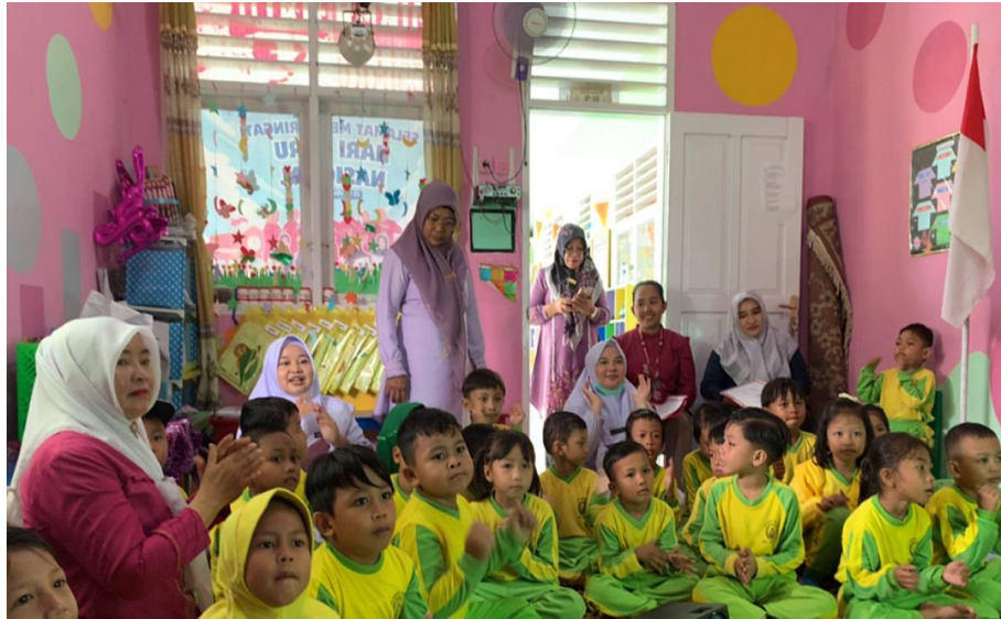
Gambar 2. Penyuluhan tentang perilaku Bullying

ketakutan, dan depresi pada korban sehingga pencegahan sejak usia dini sangat penting dilakukan (Setiawan & Saputra, 2024). Kegiatan Pengabdian Masyarakat ini sudah dilakukan sesuai tahap yang di rencanakan. Kegiatan ini dilakukan bersama guru dari sekolah TK/Paud, tim Dosen dan Mahasiswa. Pada gambar 1 adalah jalannya kegiatan yang dilakukan pada saat penyuluhan dan gambar 2 adalah foto bersama peserta penyuluhan.