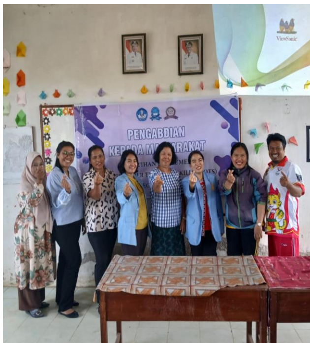
Gambar 2. Foto Ketua dan anggota bersama guru

Pada kegiatan workshop, peserta pelatihan dibimbing untuk membuat media pembelajaran. Pada sesi pertama kegiatan workshop, setiap guru diminta untuk menentukan topik pembelajaran PKn sebagai bahan ajar yang akan dibuat. Kemudian peserta diminta mencari sumber bahan ajar dari Internet baik yang berupa media tulisan, gambar