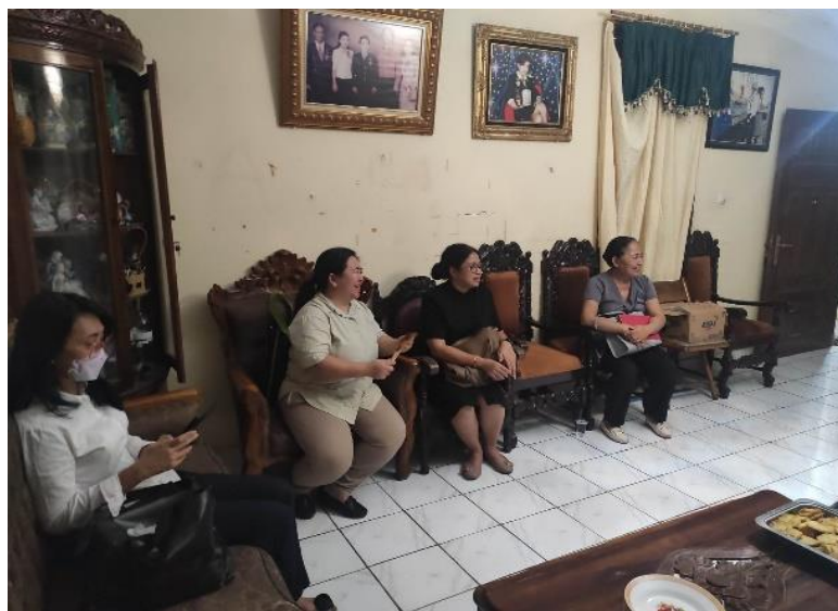
Gambar 1. Penyampaian Materi Oleh Tim PKM

Kegiatan kedua dilaksanakan di Jemaat GMIM Sion Bailang pada tanggal 19 September 2024 dan diikuti oleh 17 peserta. Susunan kegiatan sama dengan pelaksanaan di Jemaat GMIM Kalvari Malalayang Satu. Selama sesi penyuluhan, peserta menunjukkan antusiasme yang tinggi, terlihat dari banyaknya pertanyaan yang diajukan mengenai gizi ibu hamil, anemia, pola makan remaja putri, pemberian makanan bayi, serta upaya pencegahan stunting dalam lingkungan keluarga (Gambar 2).