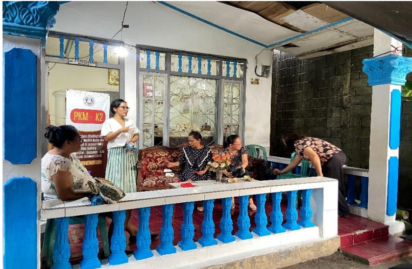
Gambar 3. Pembagian Leaflet Dan Diskusi