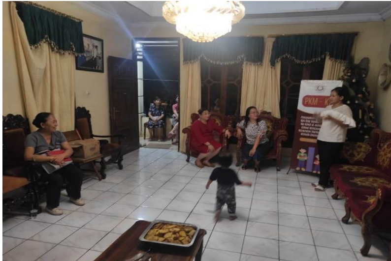
Gambar 2. Pengantar dan Perkenalan Tim PKM

Selanjutnya dilakukan kegiatan asesmen lapangan pada awal April 2024 untuk mengidentifikasi kondisi objektif masyarakat, kebutuhan informasi kesehatan, serta tingkat pemahaman awal peserta mengenai stunting. Hasil asesmen menunjukkan bahwa sebagian besar wanita muda dan ibu hamil belum memahami secara komprehensif penyebab, dampak jangka panjang, maupun langkah-langkah pencegahan stunting sejak masa remaja dan kehamilan. Selain itu, belum pernah dilaksanakan program edukasi khusus mengenai stunting di kedua jemaat sehingga kebutuhan terhadap informasi kesehatan yang benar dan mudah dipahami menjadi sangat tinggi.