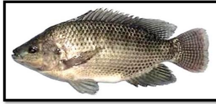
Gambar 1. Morfologi Ikan Nila ( Oreochromis Niloticus ).