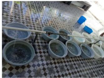
Gambar 3. Proses Grading

Grading pada tahap awal pemeliharaan larva kerapu cantang dilakukan umur D26-D28. Grading ini bertujuan untuk mengkategorikan larva menjadi dua kelompok berdasarkan ukuran, larva ukuran besar dan larva ukuran kecil. Grading dilakukan dengan mengambil benih kerapu cantang kemudian ditempatkan di permukaan air dan dilengkapi aerasi. Selama proses benih secara bertahap dimasukkan ke dalam perangkat grading yang mempunyai berbagai ukuran dari 2,2 sampai 3 cm. Grading merupakan proses dengan tujuan mengelompokkan benih sesuai dengan ukuran. Tindakan grading dilakukan untuk mencegah kanibalisme di antara ikan, yang dapat menjadi masalah serius jika frekuensi pakan tidak mencukupi ( Firdausi dan Mubarak, 2021).