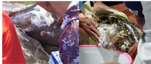
Gambar 1. Kelamin kerapu kertang jantan dan kelamin kerapu macan betina

Tahapan selanjutnya sebelum proses hibridisasi yaitu seleksi induk kerapu macan dan kerapu kertang yang telah matang gonad, aktif, sehat tanpa cacat, dan nafsu makan baik. Induk kerapu macan betina yang matang gonad seperti, perut bulat membesar, warna merah pada perut hingga lubang genital, dan posisi kepala dibawah saat berenang. Induk kerapu kertang jantan yang matang gonad seperti, gerakan sangat agresif, produksi sperma saat distripping, dan perubahan warna merah pada alat kelamin.