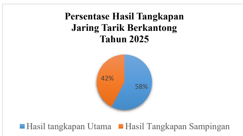
Gambar 2. Grafik persentase hasil tangkapan.