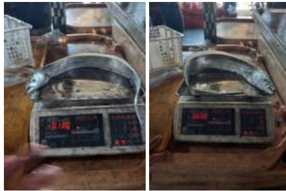
Gambar 1. berat ikan layur yang tertangkap.

layur peneliti terkadang juga memndapatkan ikan lain ( non target ) yang tertangkap seperti ikan Barakuda ( Spyraena barracuda ). Berat ikan layur yang tertangkap selama penelitian beragam, mulai dari berat 100 gram sampa 600 gram. Ikan layur ( Trichiurus lepturus ) memiliki ciri morfologi, tubuh memanjang dan sangat pipih seperti pita. Mulut besar dengan gigi seperti taring. Ukuran mata besar dengan diameter mata 5 - 7 kali panjang kepala. Sirip dorsal tinggi dan panjang dengan jumlah sirip lemah sebanyak 130 – 135. Tidak mempunyai sirip kaudal dan sirip pelvic. Sirip anal tereduksi menjadi menjadi sejumlah duri terpisah (slit) namun tidak terkubur dalam kulit. T. lepturus mempunyai slit pada sirip anal kecil dan halus. Panjang maksimum tubuhnya adalah 120 cm, pada umumnya memiliki panjang tubuh antara 50 - 100 cm. Warna tubuh saat segar adalah biru baja dengan refleksi metalik, dan sirip pektoral semi transparan, bagian sirip lainnya terkadang dilengkapi warna kuning. Sedangkan dalam keadaan mati ikan layur akan berwarna perak keabuan (Nakamura dan Parin, 1993).